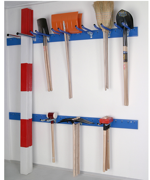
Rail horizontal à fixer au mur pour objets suspendus ou appuyés, avec consoles à fourche et consoles tubulaires