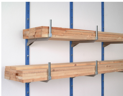
Consoles lourdes avec nez et sécurité anti-chute