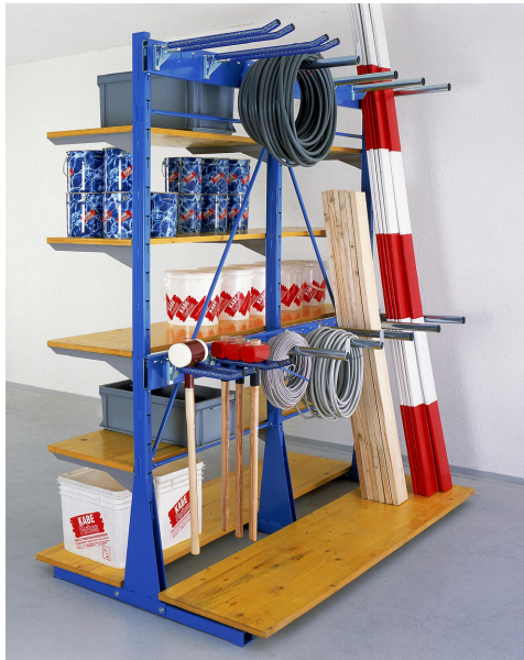
Etagère pose libre, avec consoles lourdes des deux côtés, consoles à fourche, tubulaires et pour câbles