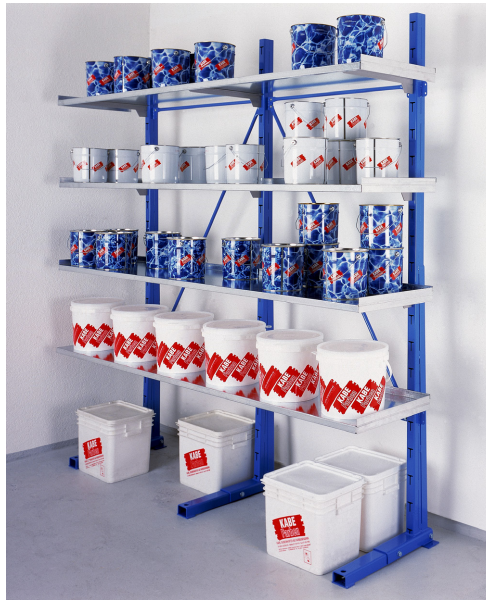
Etagère pose libre, un côté avec rayons en tôle zinguée