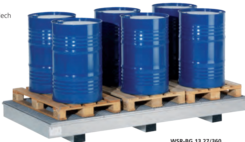
WSR-BG 13.27/360, Artikel-Nr. R23-1902-F